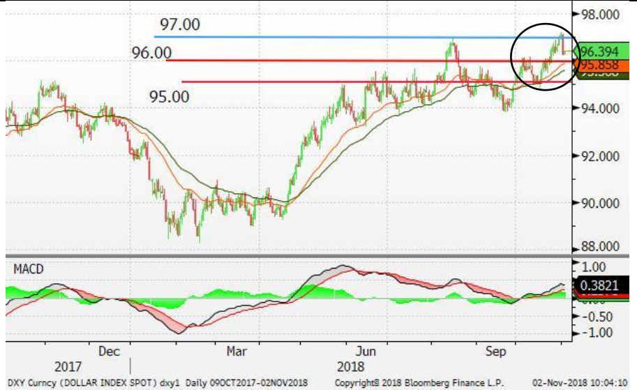
图 2：美元指数 -日线图：美元指数一度突破 97 后回落。多方力量减弱，美元指数进一步上升的空间有限。短期内，美元料维持在 96-97 空间波动。