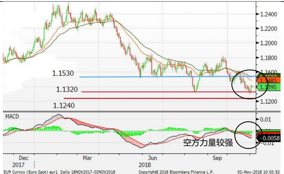
图 3：欧元/美元-日线图：欧元在 1.1320 找到支持并反弹，惟空方力量依然较强，欧元料难以完全逆转弱势。关注欧元能否企稳 1.1320。