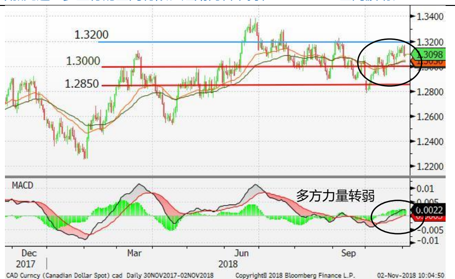
图5：美元/加元 - 日线图：美元/加元震荡走高。不过，多方力量转弱，美元/加元进一步上行的空间有限。短期内料维持在1.30-1.32区间波动。