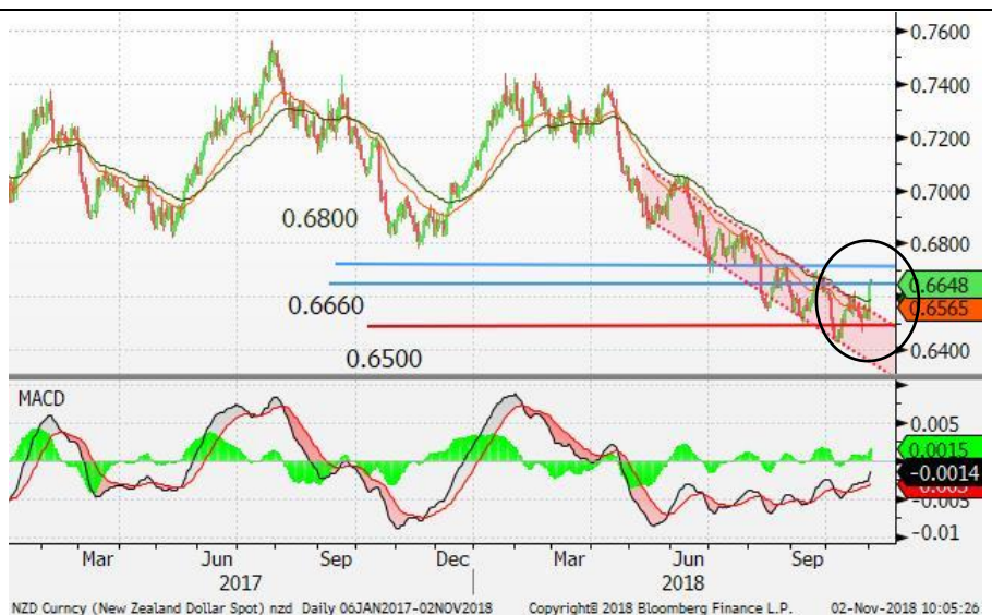
图7：纽元/美元 - 日线图：纽元突破下行通道并进一步走高。若纽元能企稳0.6660的水平，这或意味着纽元的下行走势暂时完结。