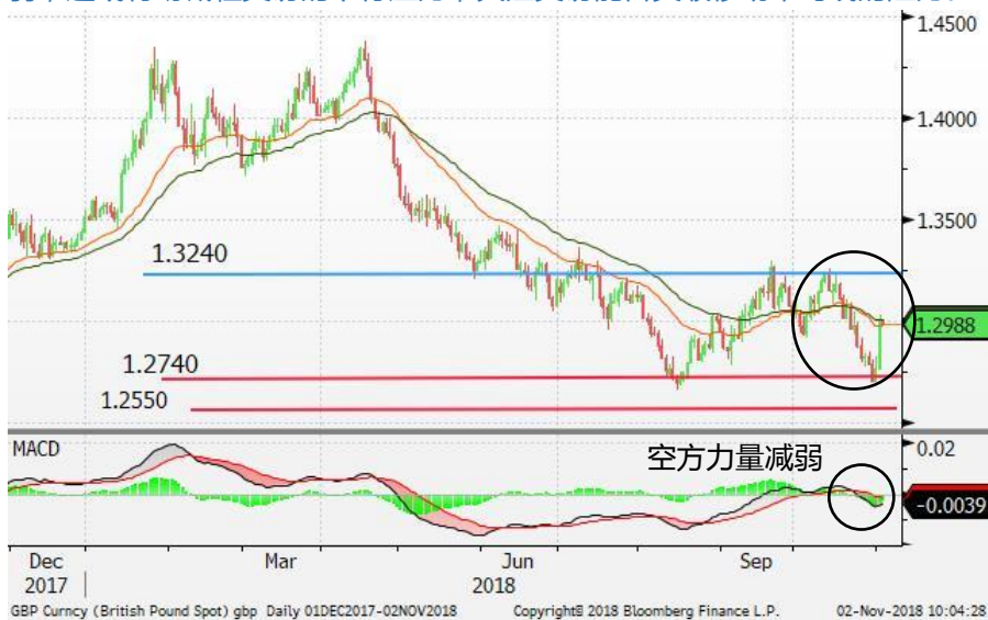
图 1：英镑/美元-日线图：英镑在 1.2740 找到支持并反弹。空方力量减弱，这或有助减轻英镑的下行压力，关注英镑能否突破移动平均线的阻力。